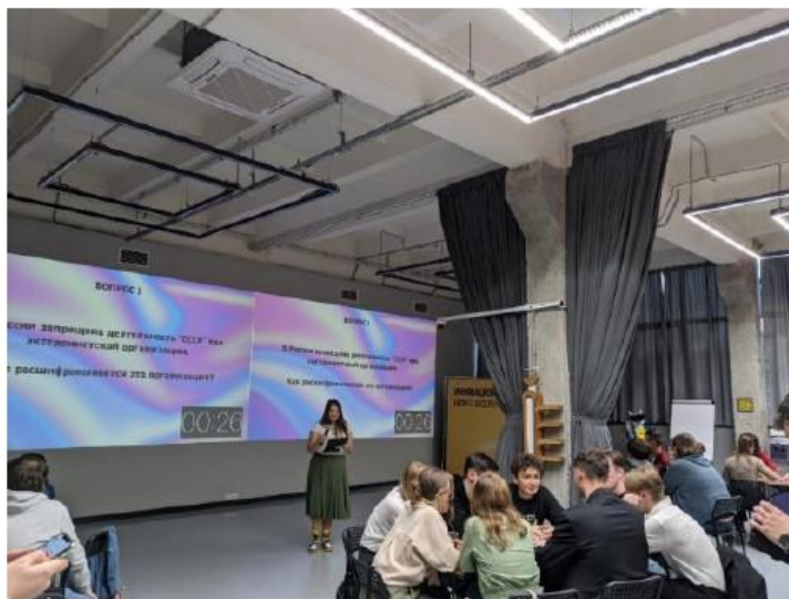
Рисунок 2 - Фрагмент квиза

Особенность: не стоит забывать, что ключевая цель мероприятия - профилактическая, поэтому особый акцент стоит сделать именно на объявлении правильных ответов, поясняя их и отвечая на все возникающие вопросы (см. рисунок 3).